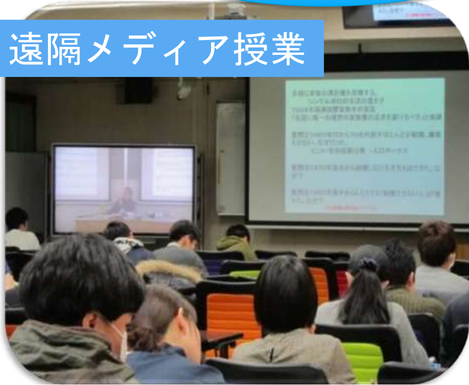
群馬大学で宇大の授業を受講