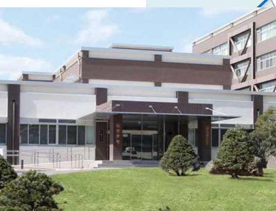
共同教育学部玄関