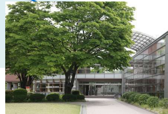
大学会館 (学食・購買・ホール)