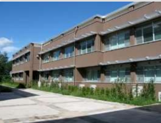
共同教育学部講義棟